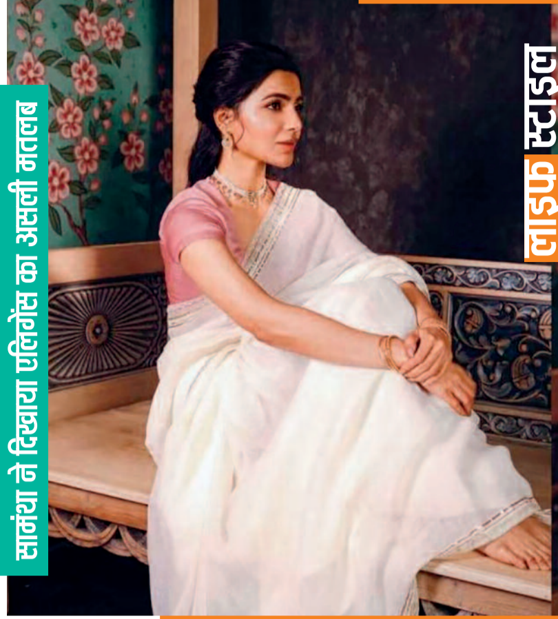
सांभंथा ने दिखाया एलिगेंस का असली मतलब

फैशन की दुनिया में सादगी का क्रेज एक बार फिर लौट आया है और अभिनेत्री सांभंथा रूथ प्रभु का यह क्लासिक साड़ी लुक इस बात का बेहतरीन उदाहरण है कि मिनिमल स्टाइल भी बेहद रॉयल लग सकता है। यह पारंपरिक अवतार आज की महिलाओं के लिए एक परफेक्ट स्टाइल इन्सपिरेशन है जो ट्रेंड्स के शोर से दूर रहकर टाइमलेस एलिगेंस को अपनाया चाहती हैं।